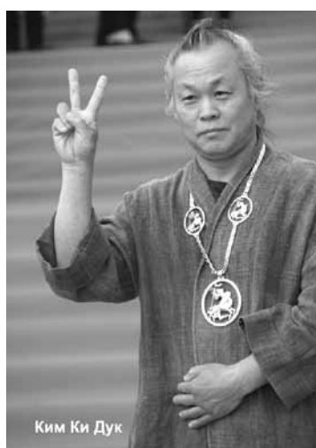
Ким Ки Дук