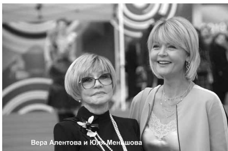
Вера Алентова и Юлия Менашова