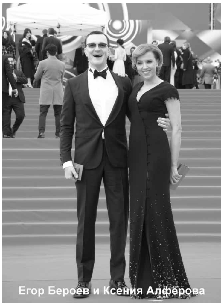
Егор Бероев и Ксения Алферова